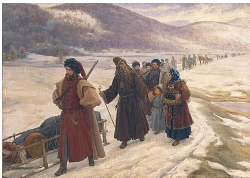
Путешествие Аввакума по Сибири