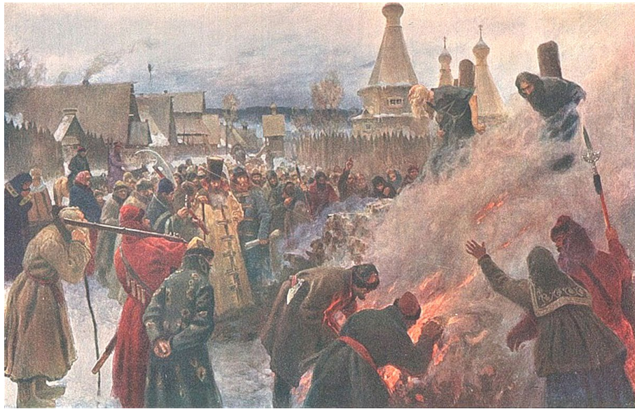
Сожжение протопопа Аввакума Пётр Мясоедов, 1897 г.

14 апреля 1682 года Аввакум был заживо сожжен в срубе вместе с тремя единоверцами. Рядом собрались бояре, купцы, простые местные жители и молча наблюдали за свершением приговора. Протопоп Аввакум, собираясь на смертную казнь, в последний раз обратился к своей пастве. Его последними словами было «Храните веру старую». Последнее, что люди увидели сквозь пламя – его поднятая к небу рука. Он благословлял народ двумя перстами.